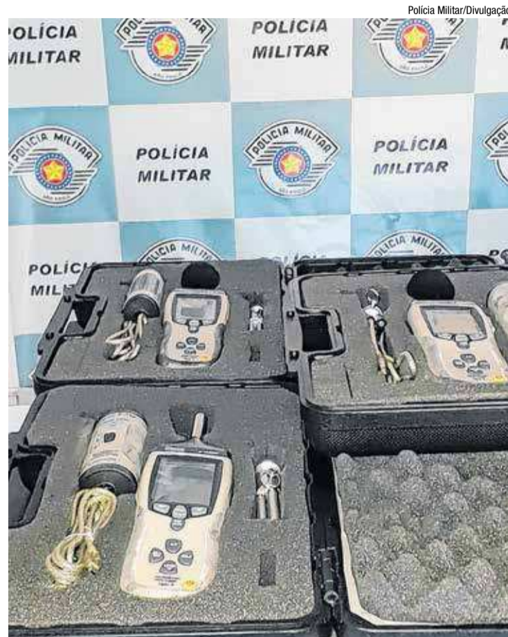
Os três decibelímetros foram doados pela Emdurb para a PM

É a quantidade máxima de ruído permitida pela legislação