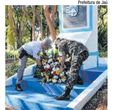
Prefeitura de Jaú

Jardim de Baixo abriga monumento em homenagem à Revolução de 1932