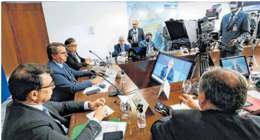
Bolsonaro comanda a videoconferência da 58ª Cúpula dos chefes de Estado do Mercosul

Segundo Bolsonaro, o Brasil não vai parar nos esforços para modernizar sua economia e sociedade. "Queremos que nossos sócios de integração sejam nossos companheiros nessa caminhada para a prosperidade comum. É por isso que, em nossa presidência de turno que se inicia hoje, continuaremos a trabalhar pelos valores originais do bloco, associados à abertura e à busca da maior e melhor integração de nossas economias nas cadeias regionais e internacionais de valor". Bolsona-