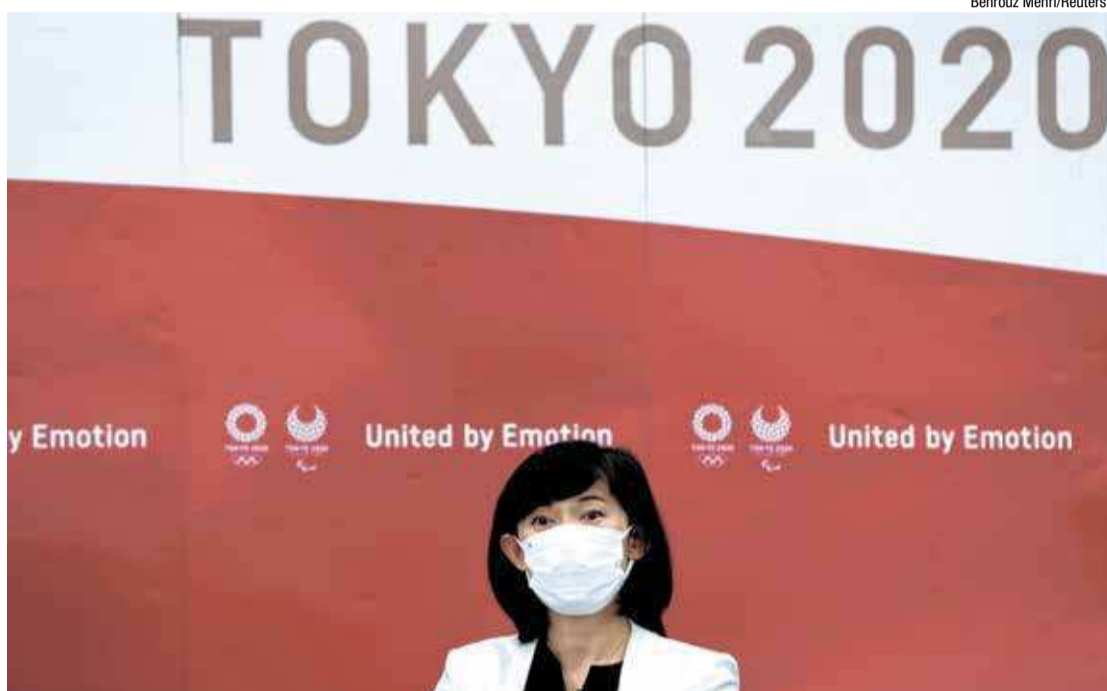
Tamayo Marukawa, ministra responsável pela organização dos Jogos, anunciou decisão de vetar público por causa da pandemia de coronavírus

Entretanto, para evitar que novos casos surjam, foi tomada a decisão de vetar a pre-