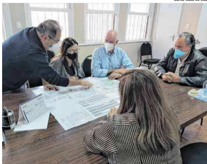
Santa Casa de Jaú

Segundo informações da Polícia Rodoviária, as vítimas estavam em um Fox com placas de São Paulo que, por razões a serem apuradas, bateu na traseira de um caminhão. O homem, condutor do carro, e a mulher, passageira do banco da frente, morreram no local. As identidades não foram reveladas pela polícia.