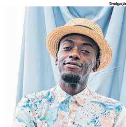
Jota.Pê, ex-The Voice Brasil 2017, participa da canção com Thomé

é trazer para os fãs a possibilidade de colecionar itens utilizados nos vídeos de suas canções. Em ‘Receita Do Tempo’ isso não será diferente. Cinco pôsteres exclusivos com capas alternativas/encartes do single serão produzidos. Neles, um vaso com uma plantinha, “em diferentes estágios da vida” representando o local de florescimento de ideias e possibilidades no decorrer do tempo, será distribuído aos seguidores que se destacarem em uma gincana nas redes sociais do cantor. Basta fazer o pré-save da canção e anotar os ingredientes da receita do tempo que serão anunciados durante a semana no perfil do Instagram de Thomé. As cinco primeiras pessoas a reunirem cinco ou mais ingredientes dos sete que serão publicados receberão o pôster autografado.