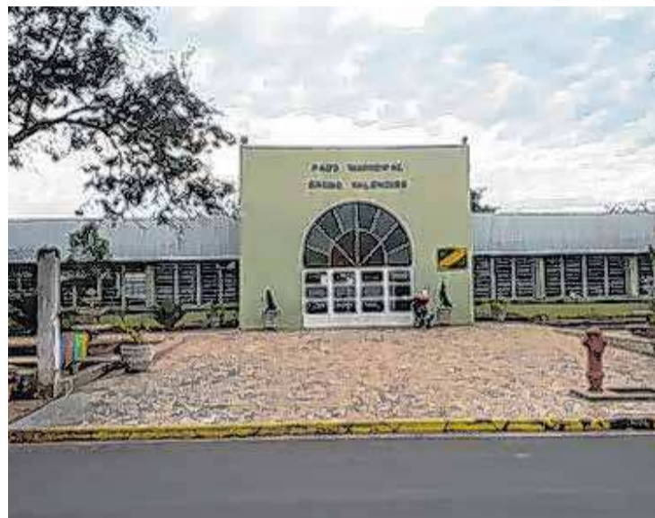
Câmara de Torrinha

A outra ação civil diz respeito à aquisição, também sem licitação, de quatro mil jornais, no formato tabloide, com informações sobre as medidas de combate à Covid-19 adotadas em Torrinha. O material, comprado pelo valor de R$ 3.900,00, foi custeado com dinheiro público e distribuído em toda a cidade. De acordo com o promotor de Justiça que assina a ação, o folheto tinha como objetivo promover pessoalmente o então prefeito e não informar a população. Por meio de um advogado, o ex-prefeito informou que ainda não foi notificado sobre as duas ações.