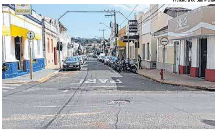
Prefeitura de São Manuel

Em Pederneiras (26 quilômetros de Bauru), o novo decreto estabelece o horário má-