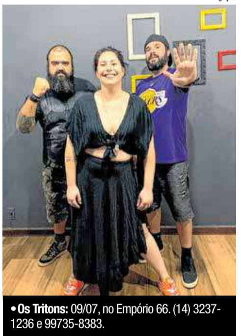
• Os Tritons: 09/07, no Empório 66. (14) 3237-1236 e 99735-8383.