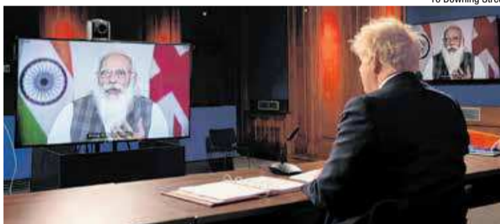
10 Downing Street

Em Auckland, na Nova Zelândia, um dos menores índices de casos, a distância é reforçada