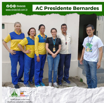
AC Presidente Bernardes